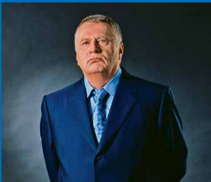
Жириновский Владимир Вольфович – депутат ГД РФ, Председатель ЛДПР