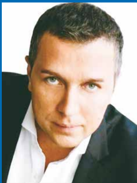
Старовойтов Александр Сергеевич – депутат ГД РФ, член комитета по транспорту